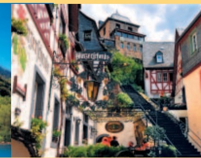
Klosterstiege in Beilstein